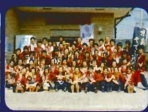
京都学生祭典 「京炎 そでふれ!」普及チーム