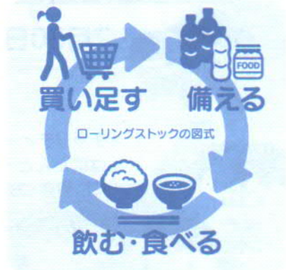
ローリングストックの図式

食品は常温保存できるインスタントやレトルト、フルーツの缶詰、乾物やお菓子、根菜類などが適しています。また飲料水や水分補給ゼリーのほか、水道水を日々の水やりや洗濯などに使いながら、汲み置きしておくで役立ちます。最初の3日間は冷蔵庫内の消費で、残り4日分はローリングストックで賄うイメージで計一週間分用意しておきましょう。